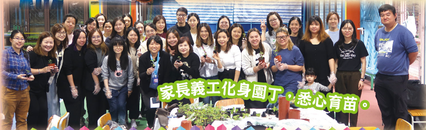
家長義工化身園丁，悉心育苗。