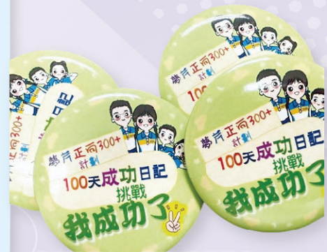
成功挑戰100天的獎勵襟章