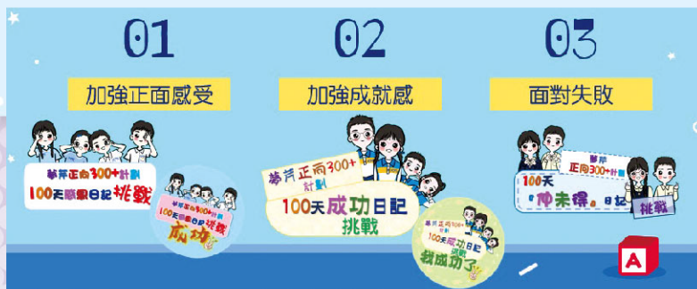
三年輔導計劃 - 下年度 (26-27年度) 為「仲未得」日記！