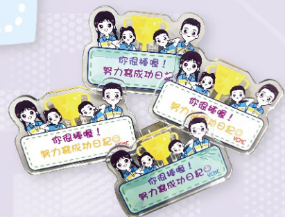
完成P.5-6 及 5-14頁的精美禮物 【成功日記禮物】